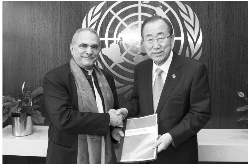
Der Vorsitzende der Hochrangigen unabhängigen Gruppe für Friedensmissionen José Ramos Horta (l.) überreichte den Bericht der Gruppe »Uniting our Strengths for Peace – Politics, Partnership and People« an UN-Generalsekretärs Ban Ki-moon am 16. Juni 2015 in New York.

Zu Beginn des Berichts hebt die Gruppe hervor, dass die UN-Friedensmissionen sich als »äußerst anpassungsfähig« erwiesen und zu einem Rückgang der Anzahl an Konflikten in den letzten zwei Jahrzehnten beigetragen hätten. Gleichzeitig verweist sie auf den beunruhigenden Anstieg an Bürgerkriegen und Angriffen auf Zivilpersonen in den zurückliegenden Jahren. Sie betont darüber hinaus, dass sich die Art der Konflikte mehrmals gewandelt hätte, was die Fähigkeit der Vereinten Nationen, sich daran anzupassen, übersteigen könnte; hier vor allem der gewaltsame Extremismus. Die Hochrangige Gruppe betont, dass einige Friedensmissionen in Umgebungen zum Einsatz kämen, wo »es keinen Frie-