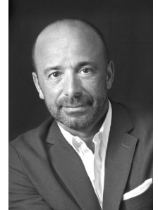
Miguel de Serpa Soares , geb. 1967, aus Portugal ist seit 2013 UN-Untergeneralsekretär für Rechtsangelegenheiten und Rechtsberater der Vereinten Nationen.

Nach Artikel 4 Absatz 1 UN-Charta können alle »friedliebenden« Staaten Mitglied der Vereinten Nationen werden, wenn sie bereit sind, die Verpflichtungen der Charta zu übernehmen. Die Mitgliedschaft in den UN und die Mitarbeit in ihren Gremien und Foren ist für viele Mitgliedstaaten, insbeson-