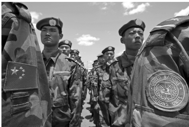
Chinesische Pioniereinheit im Dienst von UNAMID in Nyala, Sudan, Juli 2008.