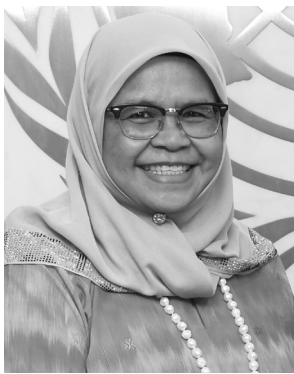
Maimunah Mohd Sharif

Die Ernennung von Maimunah Mohd Sharif aus Malaysia zur Exekutivdirektorin für das Programm der Vereinten Nationen für menschliche Siedlungen (UN-Habitat) erfolgte am 22. Dezember 2017 durch UN-Generalsekretär António Guterres. Die Nachfolgerin des Spaniers Joan Clos (vgl. Personalien, VN, 2/2011, S. 83) stand zuvor als Bürgermeisterin dem malaysischen Stadtrat von Penang Island vor. Sie setzte sich vor allem für eine nachhaltige Stadtentwicklung ein. Ihre Karriere begann Sharif im Jahr 1985 als Stadtplanerin, von 2003 bis 2009 war sie als Direktorin für Planung und Entwicklung in die Gestaltung von Penang City und mit der Leitung der UNESCO-Weltkulturerbestätte George Town befasst.