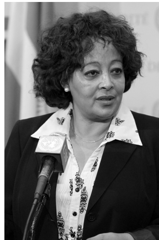
Hiroute Guebre Sellassie

Seit der Einrichtung im Jahr 2011 leitete Abou Moussa aus Tschad als Sonderbeauftragter das Regionalbüro der Vereinten Nationen für Zentralafrika (UNOCA) in Libreville, Gabun. Nach 34 Jahren bei den Vereinten Nationen scheidet er aus dem Dienst aus. Er wurde am 1. Mai 2014 durch den Senegalesen Abdoulaye Bathily abgelöst. Dessen Erfahrungen als ehemaliger Stellvertretender Sonderbeauftragter der Mehrdimensionalen integrierten Stabilisierungsmission der Vereinten Nationen in Mali (MINUSMA) werden ihm dienlich sein. Diesen Posten