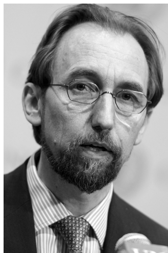
Zeid Ra'ad Zeid Al-Hussein

tärs zu. Der im Jahr 1964 in Amman geborene Prinz ist der erste Araber und Muslim auf diesem Posten. Er löst die Südafrikanerin Navi Pillay ab, die das Amt von September 2008 an innegehabt hat. Ihre zweite Amtszeit wurde nur um zwei statt der üblichen vier Jahre verlängert, bedingt durch Vorbehalte von Seiten der USA gegenüber Pillays Position hinsichtlich Israel und Palästina. Pillay war es gelungen, das Amt als unabhängige, allein dem Menschenrechtsschutz verpflichtete Institution weiter zu festigen. Ihr Nachfolger, Prinz Zeid, muss sich als ehemaliger Staatenvertreter und Diplomat diese Unabhängigkeit erst noch erarbeiten. Er bekleidete von 2000 bis 2007 sowie von 2010 bis 2014 das Amt des Ständigen Vertreters Jordaniens bei den Vereinten Nationen in New York. Dazwischen war er Botschafter in Washington, D.C. Im Jahr 2002 wurde er zum ersten Präsidenten des Verwaltungsrats des Internationalen Strafgerichtshofs (IStGH) gewählt und war an der Gründung des IStGH maßgeblich beteiligt. Im Jahr 2005 hatte er im Auftrag des damaligen UN-Generalsekretärs Kofi Annan einen viel beachteten Bericht