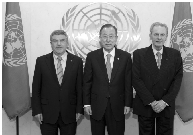
Ban Ki-moon (Mitte) mit Thomas Bach (links) und Jacques Rogge im April 2014 in New York.

Ban Ki-moon ernannte am 28. April 2014 den Belgier Jacques Rogge zum Sondergesandten für Jugendliche Flüchtlinge und Sport. Rogge war von 2001 bis 2013 Präsident des Internationalen Olympischen Komitees (IOC) und ist seitdem dessen Ehrenpräsident. In seiner Zeit als Präsident festigte er eine enge Partnerschaft zwischen dem IOC und den Vereinten Nationen. Ein sichtbares Ergebnis dieser Bemühungen war die Gewährung des Beobachterstatus in der UN-Generalversammlung im Oktober 2009. Weltweit sind mehr als 44 Millionen