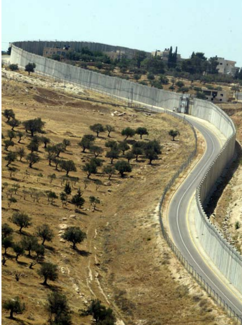
Israel besteht aus Sicherheitsgründen auf den 708 Kilometer langen Sperrzaun aus Draht, Videokameras und acht Meter hohen Betonquadern. Der Verlauf der Mauer, hier in der Stadt Abu Dis, wurde vom Internationalen Gerichtshof für illegal erklärt.

linge heraus. Wie der Sonderberichterstatter bereits 2005 feststellte, birgt die als „Ent-Palästinensierung“ (de-Palestinization) bezeichnete demographische Entwicklung in dem geschlossenen Gebiet die Gefahr, dass sich die israelischen Behörden des „verlassenen“ Landes bemächtigen und den expandierenden Siedlungen zur Verfügung stellen. Sieben Jahre nach Veröffentlichung des Gutachtens des IGH gibt es keinen Anlass zur Entwarnung. Israel hat vor allem in Jerusalem weitere Fakten geschaffen. Wenn die Mauer gemäß heutiger Planung fertiggestellt ist, wird sie mit 708 km mehr als doppelt so lang sein wie die „Grüne Linie“ und zu 85 Prozent auf palästinensischem Territorium verlaufen, mit der Folge, dass das Gebiet eines künftigen palästinensischen Staates um 9,4 Prozent wertvollen Landes schrumpfen würde.