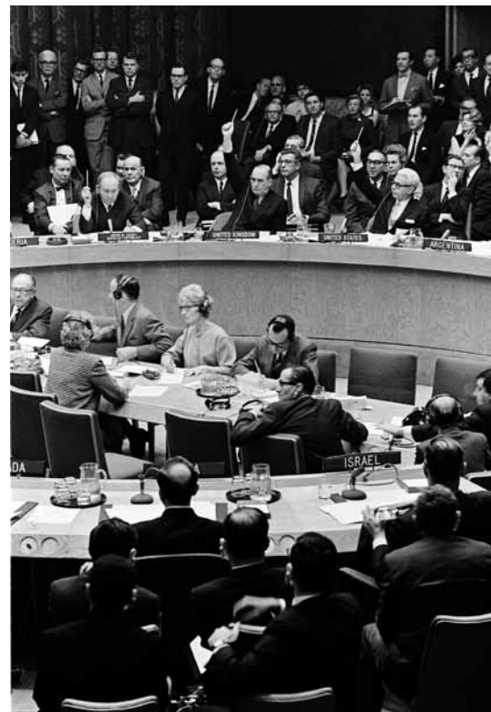
Der UN-Sicherheitsrat verabschiedet am 22. November 1967 die historische Resolution 242, auf der seitdem alle Friedensinitiativen aufbauen.

Im Gegensatz zu seinem Vorgänger Nasser versuchte der neue ägyptische Präsident Anwar al-Sadat zunächst, die festgefahrene Lage diplomatisch durch Hinwendung zum Westen und versöhnliche Rhetorik gegenüber Israel zu verbessern, fand damit bei Israel aber kein Gehör. Ohne Erfolg blieben auch die Gespräche, die UN-