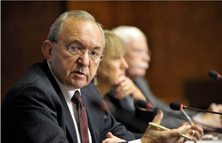
Richard Goldstone, Leiter der Ermittlungsmission der Vereinten Nationen für den Gaza-Konflikt, bei der Vorstellung seines Berichts vor dem UN-Menschenrechtsrat im September 2009. Der Bericht konstatiert sowohl auf israelischer als auch palästinensischer Seite schwere Kriegsverbrechen während des Gaza-Kriegs 2008/2009. Ebenso kritisiert er den unverhältnismäßigen Einsatz von Gewalt seitens Israels. Später distanzierte sich Goldstone von Teilen seines eigenen Berichts – seine drei Mitautoren vermuten politischen Druck hinter der Neubewertung.

löstinensischen Organisationen wurde vieles von dem schwer beschädigt oder zerstört, was in den ersten Jahren aufgebaut worden war (z.B. Justiz- und Polizeinfrastruktur, der aus Mitteln der EU und der UN erbaute Flughafen von Gaza, medizinische Versorgung, Produktionsstätten). 2007 führten innerpalästinensische Rivalitäten zur politischen Spaltung zwischen dem Westjordanland und dem Gaza-Streifen, in deren Folge auch die demokratischen Errungenschaften der Aufbaujahre verloren gingen. Auch ökonomisch driften die beiden palästinensischen Territorien auseinander: Der von Hamas regierte und von Israel abgeriegelte Gaza-Streifen, der zudem immer wieder Ziel israelischer Militäroperationen wurde, versank im Elend, während das von Fatah dominierte und von der PA regierte Westjordanland dank externer Finanzhilfen ein bescheidenes Wirtschaftswachstum erzielen konnte. Über vier Jahrzehnte Besatzung und die wiederkehrenden militärischen Operationen Israels haben den Palästinensern einen hohen Preis abverlangt: Neben mehreren tausend Toten und der massiven Einschränkung von Freiheitsrechten hebt der von arabischen Wissenschaftlern im Auftrag des UN-Entwicklungsprogramms verfasste fünfte Arabische Bericht über die menschliche Entwicklung (Arab Human Development Report, AHDR) aus dem Jahr 2009 die negativen Folgen für Einkommen, Beschäftigung, Ernährung, Gesundheit, Bildung und Umwelt hervor. Unter den Zwängen der Besatzung lebt trotz internationaler Sozialhilfe ca. ein