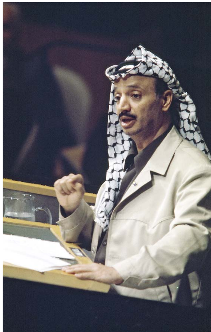
Jassir Arafat vor der UN-Generalversammlung am 13. November 1974.

Obgleich die Generalversammlung in ihrer Teilungsresolution von 1947 die Errichtung zweier Staaten für die beiden Völker vorsah und 1960 die Legitimität nationaler Befreiungsbewegungen anerkannte, wurden die Palästinenser weiterhin nur als Flüchtlinge und nicht als Volk wahrgenommen. Noch 1967 war in Resolution 242 nur vom „Flüchtlingsproblem“ die Rede, weshalb die Palästinenser und die 1964 auf Initiative Nassers gegründete PLO die Resolution lange ablehnten. Im Gegensatz zum Geist jener Resolution propagierte die PLO seit Übernahme ihrer Führung durch Jassir Arafat im Jahr 1969 den bewaffneten Kampf als das einzig legitime Mittel zur Befreiung Palästinas sowie die Vernichtung Israels. Zahlreiche Terroranschläge und