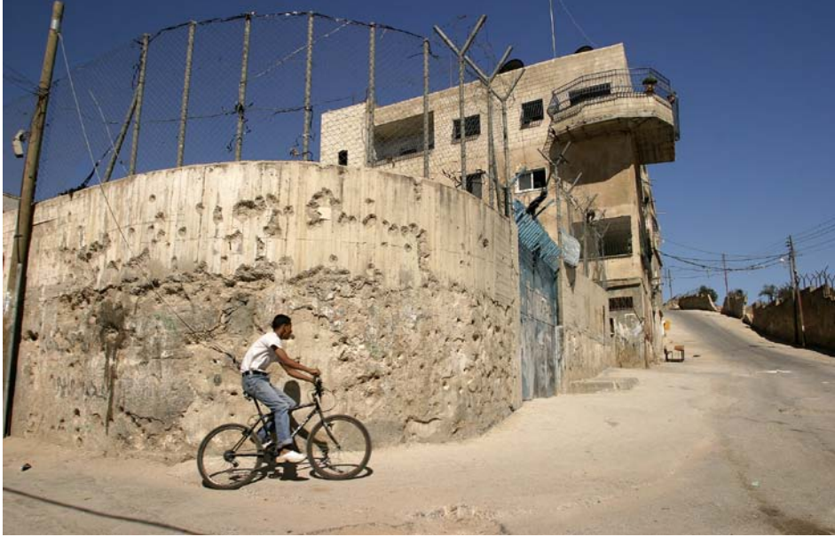
Alltagsszene aus dem von UNRWA geleiteten Aida-Flüchtlingscamp im Westjordanland.

sie das Werben Arafats innerhalb der PLO für eine politische Lösung der Palästinafrage. In einer zweiten Entschließung verlieh sie der PLO einen offiziellen Beobachterstatus mit Rederecht in der Vollversammlung. In der Folge eröffnete die PLO in vielen westlichen Hauptstädten sogenannte „Verbindungsbüros“ und Arafat wurde vielerorts wie ein Staatschef behandelt. Mit der Proklamation eines unabhängigen Staates Palästina auf dem Nationalkongress der PLO von 1988 in Algier war die Zweistaatenregelung innerhalb der PLO sichtbar mehrheitsfähig geworden. Die Vereinten Nationen verbanden ihre Anerkennung der Staatsproklamation mit einer protokollarischen Aufwertung der PLO: Die Bezeichnung der Beobachterdelegation lautet seither nicht mehr „Palästinensische Befreiungsorganisation“, sondern kurz und vielversprechend „Palästina“.