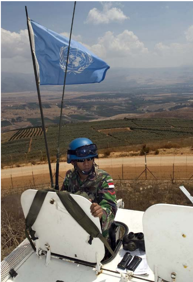
Ein UNIFIL-Peacekeeper patrouilliert an der israelisch-libanesischen Grenze.

Unter Berufung auf Art. 51 UN-Charta (Selbstverteidigung) begann am 6. Juni 1982 nach einem Attentat auf den israelischen Botschafter in London der Einmarsch israelischer Truppen in den Libanon („Frieden für Galiläa“). Erklärtes Ziel war es, die PLO zu vertreiben und zu schwächen und so die Angriffe auf den israelischen Norden zu unterbinden. Der Sicherheitsrat verlangte noch am Tag der Invasion Israels „sofortigen und bedingungslosen“ Rückzug. Die Aufforderung ignorierend rückte Israel mit etwa 60.000 Soldaten auf Beirut vor und verhängte eine Blockade, die trotz mehrfacher Aufforderung des Sicherheitsrats, sie umgehend aufzuheben, fast zwei Monate andauerte. Außerdem setzte der Sicherheitsrat die Beobachtergruppe Beirut (Observer Group Beirut) ein, deren Anwesenheit allerdings nichts zur Einhegung der ausufernden Gewalt in und um Beirut beitragen konnte. Die am 16. August wieder aufgenommene 7. Notstandssondertagung der Generalversammlung verurteilte Israel für dessen Weigerung, die Resolutionen des Sicherheitsrats umzusetzen. Israel verlangte eine internationale Truppe, die Auflösung der PLO-Basen, den Ab-