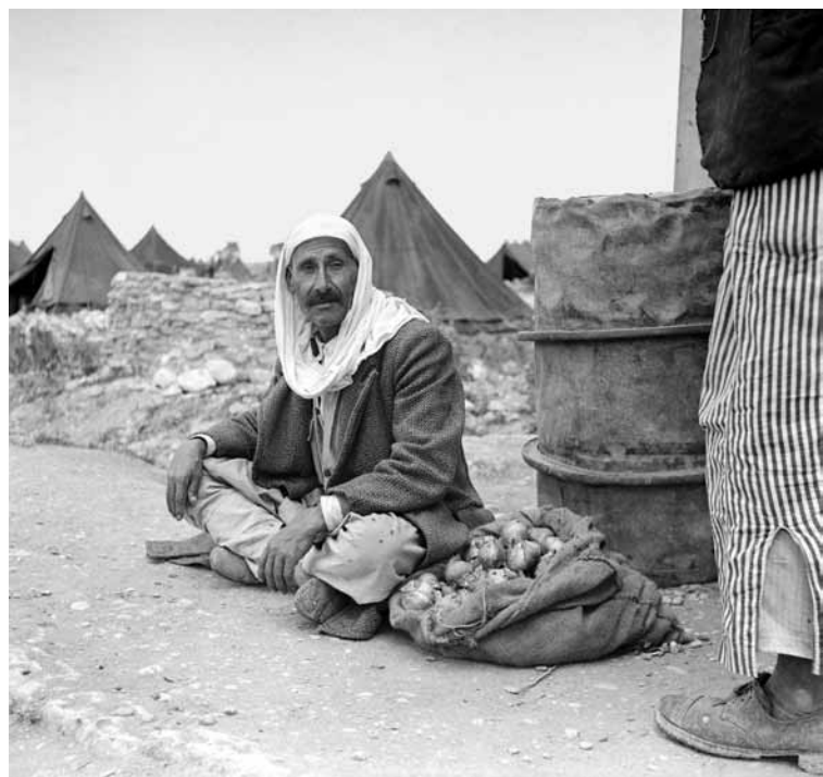
Ein palästinensischer Flüchtling des ersten arabisch-israelischen Krieges 1948/49.

Noch während der Sondersitzung der Generalversammlung proklamierte David Ben-Gurion als Vorsitzender der Jewish Agency Exekutive am 14. Mai 1948 „die Errichtung eines jüdischen Staates im Lande Israel – des Staates Israel“ – unter Bezugnahme auf die Teilungsresolution, aber bewusst ohne die Grenzen des UN-