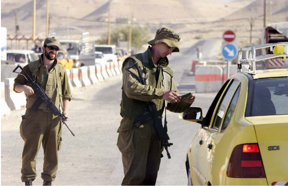
Israelische Soldaten bei der Grenzkontrolle an einem Checkpoint nahe Jericho.