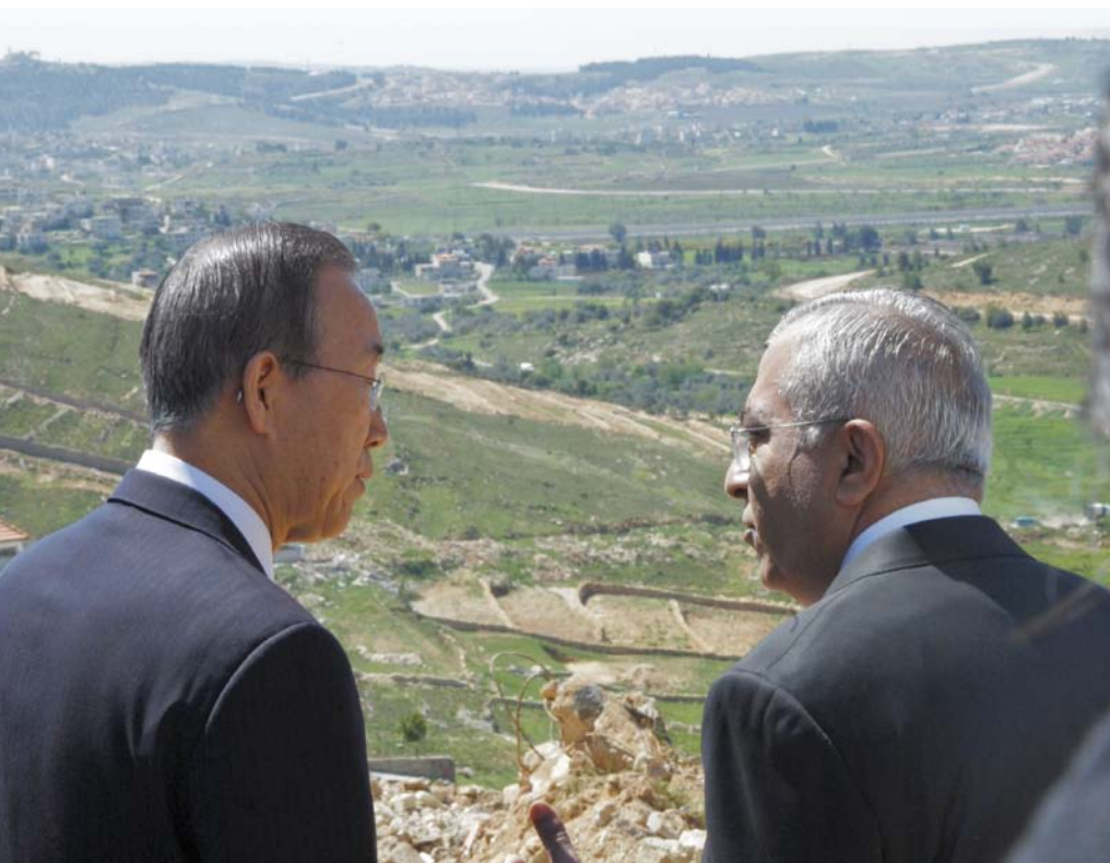
UN-Generalsekretär Ban Ki-moon und der palästinensische Ministerpräsident Salam Fayyad mit Blick auf das Westjordanland.

Stets sind die Bemühungen am gegenseitigen Misstrauen und der hohen Gewaltbereitschaft der Konfliktparteien gescheitert. Neben sicherheitspolitischen Erwägungen macht auch die religiöse Aufladung der beiden gegeneinander gerichteten Nationalismen eine Lösung ungemein schwierig. Der israelischen und der palästinensischen Gesellschaft werden auf jeden Fall bittere Kompromisse abverlangt.