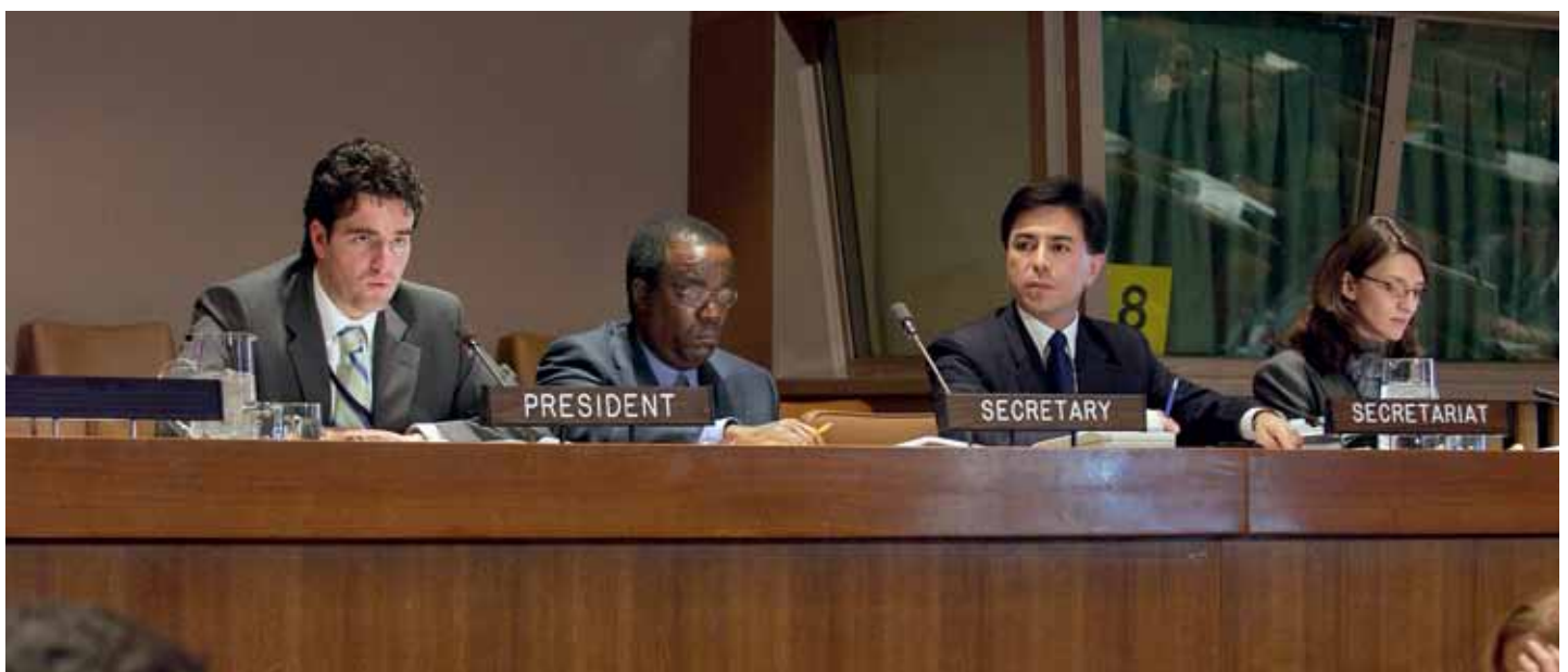
Versammlung der Vertragsstaaten des Römischen Statuts des Internationalen Strafgerichtshofs im Januar 2006 am Amtssitz der Vereinten Nationen in New York.