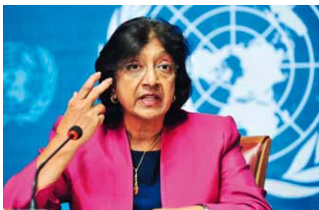
Oberste Menschenrechtshüterin der UN: Die Hohe Kommissarin für Menschenrechte, seit Juli 2008 die südafrikanische Richterin und Völkerrechtsexpertin Navanethem Pillay, steht an der Spitze des Amtes des Hohen Kommissars im schweizerischen Genf. Sie kann öffentlichkeitswirksam auf Menschenrechtssituationen aufmerksam machen und eigene Untersuchungen anstrengen. Ihre Vorgänger/innen waren Louise Arbour (Kanada, 2004 bis 2008), Bertrand Ramcharan, kommissarisch (Guyana, 2003 bis 2004), Sérgio Vieira de Mello (Brasilien, 2002 bis 2003), Mary Robinson (Irland, 1997 bis 2002) und José Ayala-Lasso (Ecuador, 1994 bis 1997).

Das Amt des Hohen Kommissars für Menschenrechte (OHCHR) wurde auf Empfehlung der Wiener Menschenrechtskonferenz im Jahr 1993 durch Resolution A/RES/48/141 der Generalversammlung mandatiert und 1994 eingerichtet. Es löste das bis dahin bestehende Menschenrechtszentrum ab. Die Aufgaben des OHCHR liegen in der Förderung und im Schutz der Menschenrechte. Das Amt koordiniert auch die entsprechenden menschenrechtlich relevanten Aufgaben innerhalb der verschiedenen Organisationen der Vereinten Nationen. Insbesondere führt