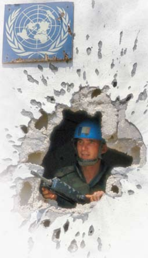
UN-Peacekeeper auf Posten – UNIFIL-Mission im Libanon.

Die traditionelle Technik der Friedenssicherung ohne Gewaltanwendung war bei