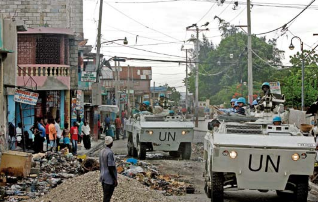
Blauhelme auf Patrouillenfahrt. Die UN-Stabilisierungsmission in Haiti (MIMUSTAH) leistet humanitäre Hilfe und sorgt für mehr Sicherheit im Konfliktgebiet.

armee der Vereinten Nationen organisiert, kurzfristig und wirkungsvoll eingesetzt werden können, bevor Konflikte eskalieren. Sie müssten ausreichend bewaffnet sein, um Gewaltausbrüche aktiv zu verhindern, die Waffenstillstände, humanitäre Nothilfe oder den Verhandlungsprozess der Streitparteien gefährden. Zu den Aufgaben würde auch gehören, die Zivilbevölkerung sowohl vor schweren Menschenrechtsverletzungen zu schützen (z.B. vor „ethnischer“ Vertreibung) als auch die Zerstörung lebenswichtiger Versorgungseinrichtungen zu verhindern. Bis heute sind allerdings keine Fortschritte in der Aufstellung solcher Truppen erkennbar. Die Mitgliedstaaten sind offenbar nicht bereit, die Autorität über ihre Truppen an die UN abzutreten.